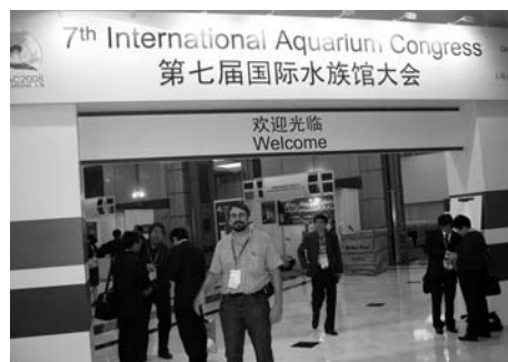
Фото 1. Холл 7-го конгресса IAC.

Нельзя не признать, что своей главной задаче - развитию взаимоотношений между аквариумами всего мира - течение конгресса соответствовало полностью.