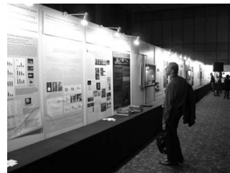
Фото 5. Стендовые и видеодоклады в зале заседаний 7-го конгресса IAC.

В качестве примера привожу аннотации для двадцати опубликованных докладов: