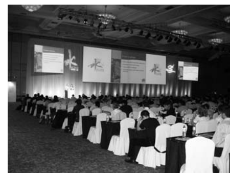
Фото 2. Зал заседаний 7-го конгресса IAC.

Базовым учреждением седьмого конгресса являлся Шанхайский Океанский Аквариум (Shanghai Ocean Aquarium - SOA).