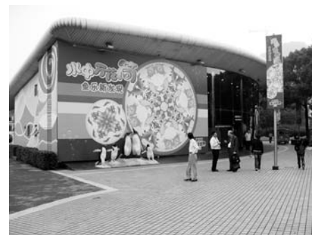
Фото 4. Вестибюль Аквариума "Shanghai Changfeng Ocean World" (основная экспозиция расположена под землей).

На увеличении числа участников конгресса сказалось также то, что ранее многие участники из Юго-Восточной Азии не могли присутствовать на заседаниях, проходивших в Европе и США по экономическим соображениям. Китай собрал их всех.