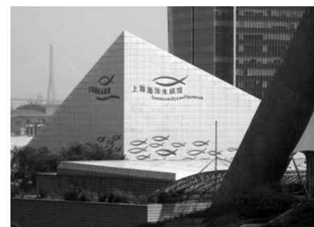
Фото 3. Здание Шанхайского Океанского Аквариума.

Конгресс был организован на очень высоком уровне, и по основным показателям оказался существенно более масштабным, чем предыдущий.