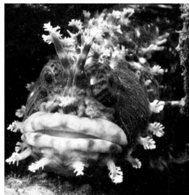
Фото 1. Японская мохоголовая собачка

Важным направлением исследований в области аквакультуры считаем разработку методов содержания и разведения представителей отечественной фауны - дальневосточных и северных морей. По красоте и привлекательности эти дальневосточные виды гидробионтов не уступят представителям зоны тропических и экваториальных морей (фото 1, 2).