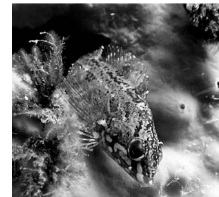
Фото 2. Восьмилинейный терпуг

Для наших учреждений остается насущной проблемой внедрение надежных систем охлаждения воды, фильтрации, других систем жизнеобеспечения гидробионтов.